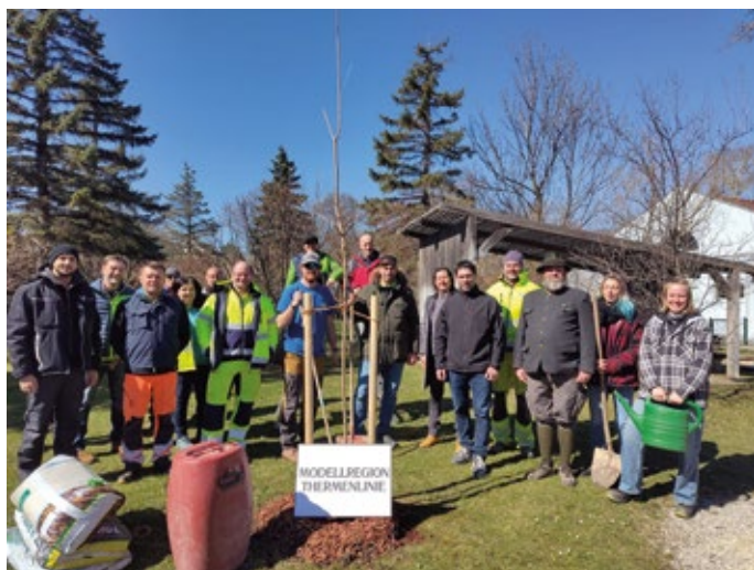
Bauhofmitarbeiter der Gemeinden welche der Modellregion Thermenlinie angehören beim Praxistag Baumpflege.

Neben der Neupflanzung spielt auch der Erhalt bestehender Altbäume eine entscheidende Rolle. Sie bieten wertvollen Lebensraum für zahlreiche Tierarten, speichern große Mengen CO 2 und tragen maßgeblich zur Klimaregulation bei. Eine regelmäßige Pflege stellt sicher, dass diese wertvollen Bäume möglichst lange erhalten bleiben und ihre positiven Effekte für die Umwelt und die Menschen entfalten können. Aufgrund der hohen Nachfrage sind bereits weitere Schulungstermine in Planung – ein wertvoller Beitrag, um unsere Gemeinde noch grüner und klimafitter zu machen!