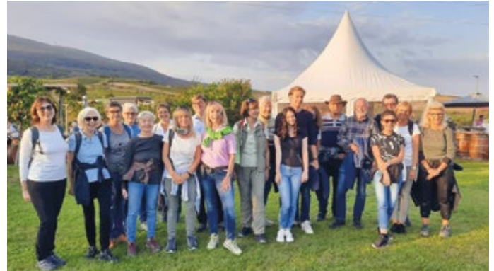
Eine von zahlreichen Veranstaltungen der Gesunden Gemeinde,

Mit Programmen und Angeboten in den Bereichen Bewegung, Ernährung und mentale Gesundheit setzt „Tut Gut!“ Impulse für einen bewussteren Lebensstil und hilft Gemeinden, Schulen, Betrieben und Familien auf ihrem Weg zu mehr Gesundheit.