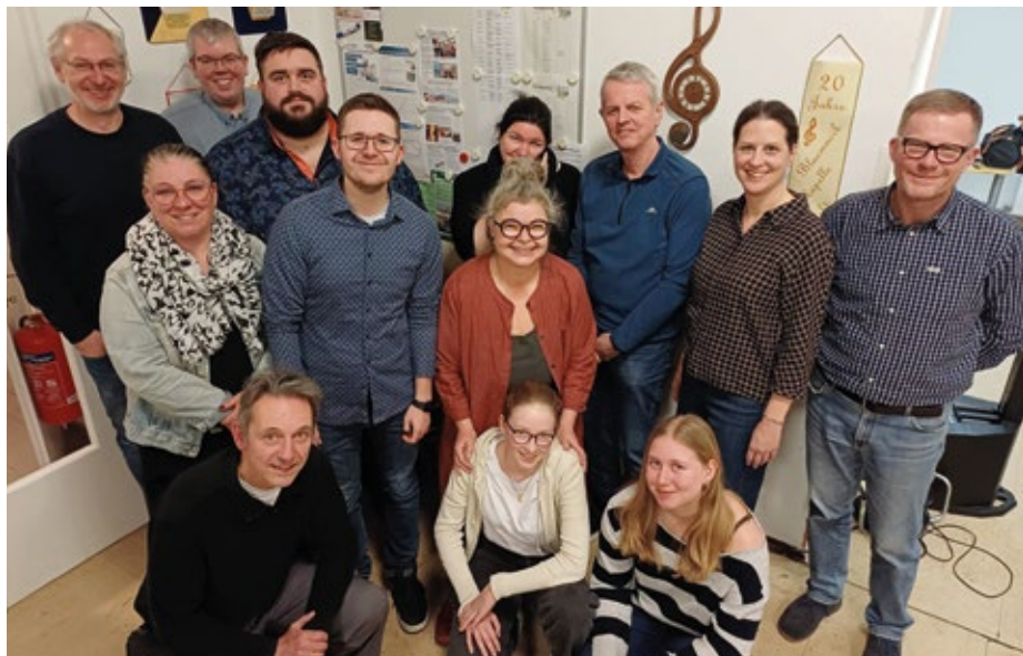
Der Musikverein „Anton Hofmann“ bei der diesjährigen Jahreshauptversammlung

Der größte Kraftakt des vergangenen Jahres lag jedoch in der Sanierung des Dachs des Musikerheims. Dank zahlreicher Spenden konnte dieses Projekt jedoch erfolgreich umgesetzt werden.