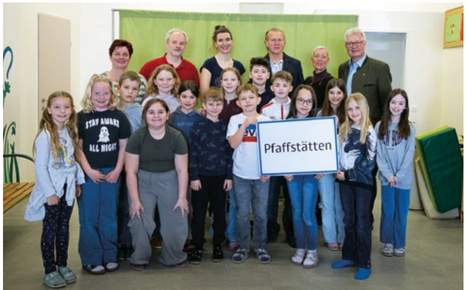
Das kindgerechte Theaterstück wurde auch an der Volksschule Pfaffstätten gezeigt.

Das Programm umfasst drei interaktive Theateraufführungen , die über einen Zeitraum von drei Wochen stattfinden. „Mein Körper gehört mir!“ vermittelt die zentralen Inhalte rund um das Thema sexueller Missbrauch einfühlsam, altersgerecht und anhand lebensnaher Szenen. Sexuelle Übergriffe auf Kinder werden klar benannt und unterschiedliche Belastungssituationen aufgezeigt. Ziel ist es, das Bewusstsein