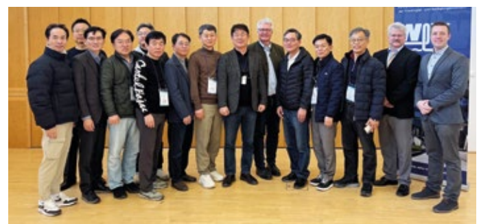
Korea Water and Wastewater Association beim WLV