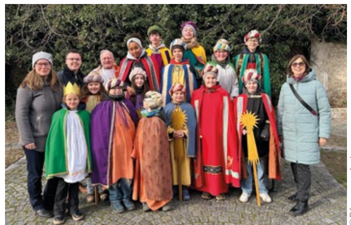
Die Sternsinger zogen durch alle Gassen von Pfaffstätten.

Begleitet wurden sie dabei von fünf erwachsenen Betreuerinnen und Betreuern, die die Gruppen organisatorisch unterstützten und für einen reibungslosen Ablauf sorgten. Täglich waren drei bis vier Gruppen unterwegs und besuchten zahlreiche Haushalte in unserer Gemeinde.