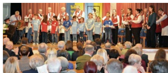
Traditionelles Neujahrstreffen: Bericht auf Seite 3