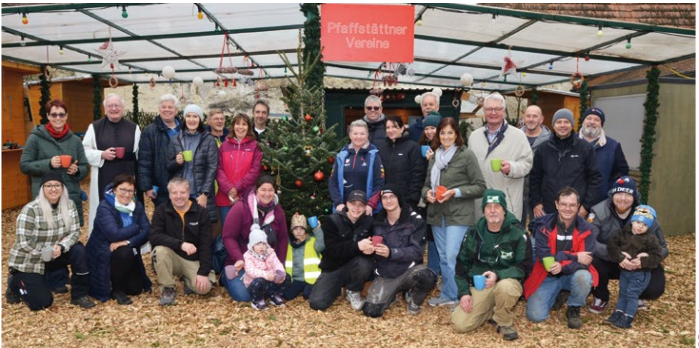
Die teilnehmenden Pfaffstättner Vereine vor der Punschütte am „Pfaffstättner Advent“