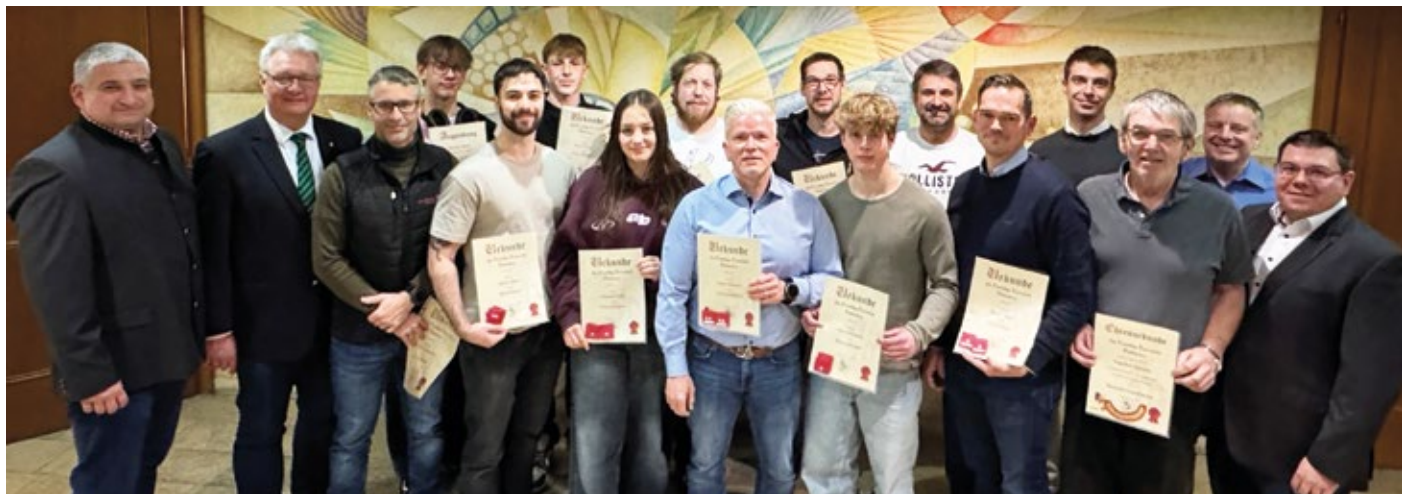
Zahlreiche Mitglieder erhielten Beförderungen sowie Dank und Anerkennung bei der Mitgliederversammlung.